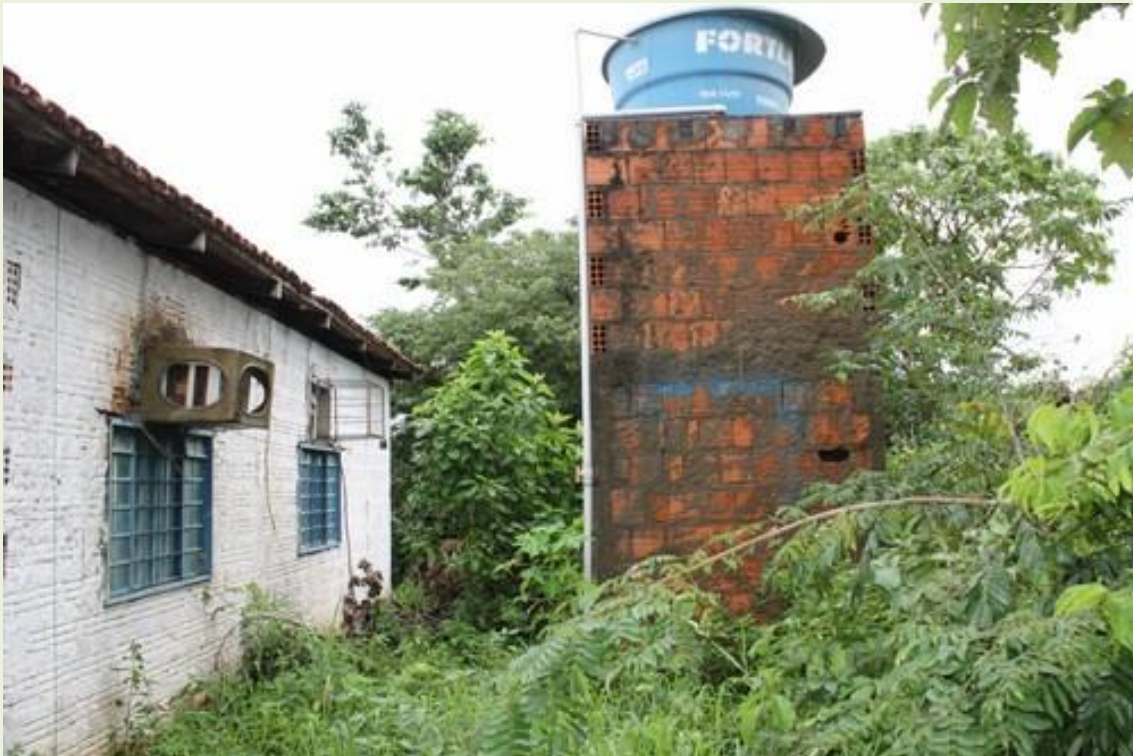
14.Fundo do posto com muita poça d'água, lixo e mato;