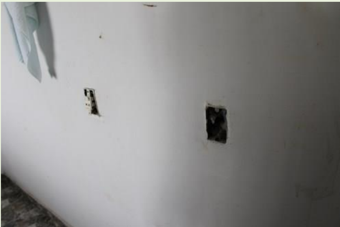
10. Tomadas elétricas expostas;