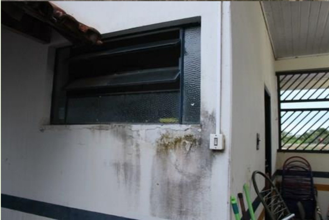
10. Diversas paredes internas e externas com infiltrações, lodos e mofos;