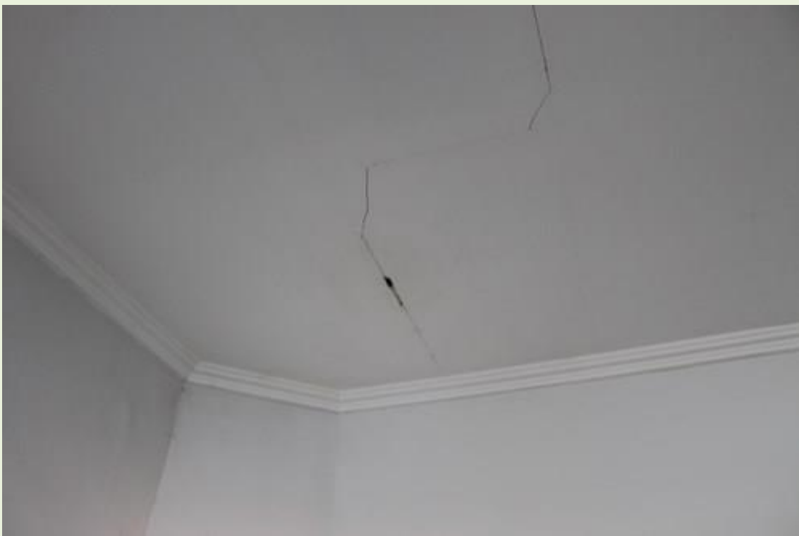
8. Forro com trincados e com risco de desabamento;