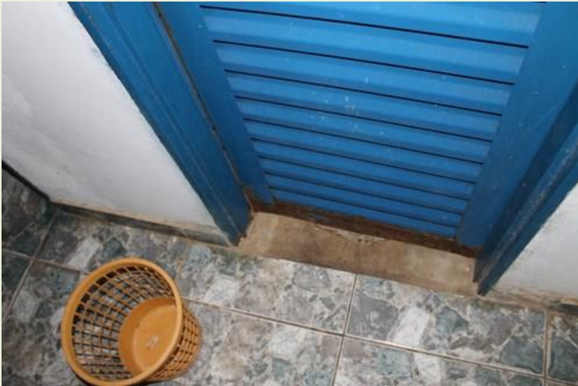
9. Falta revestimento no banheiro e a porta está enferrujada;