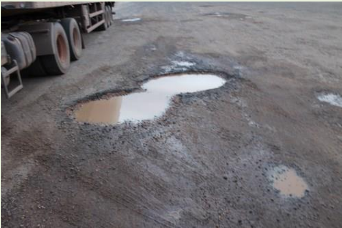
9. Buracos no pátio;