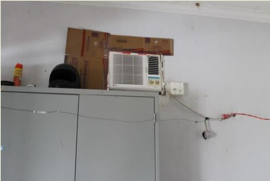
12.Ar condicionado inadequado para a abertura da parede;