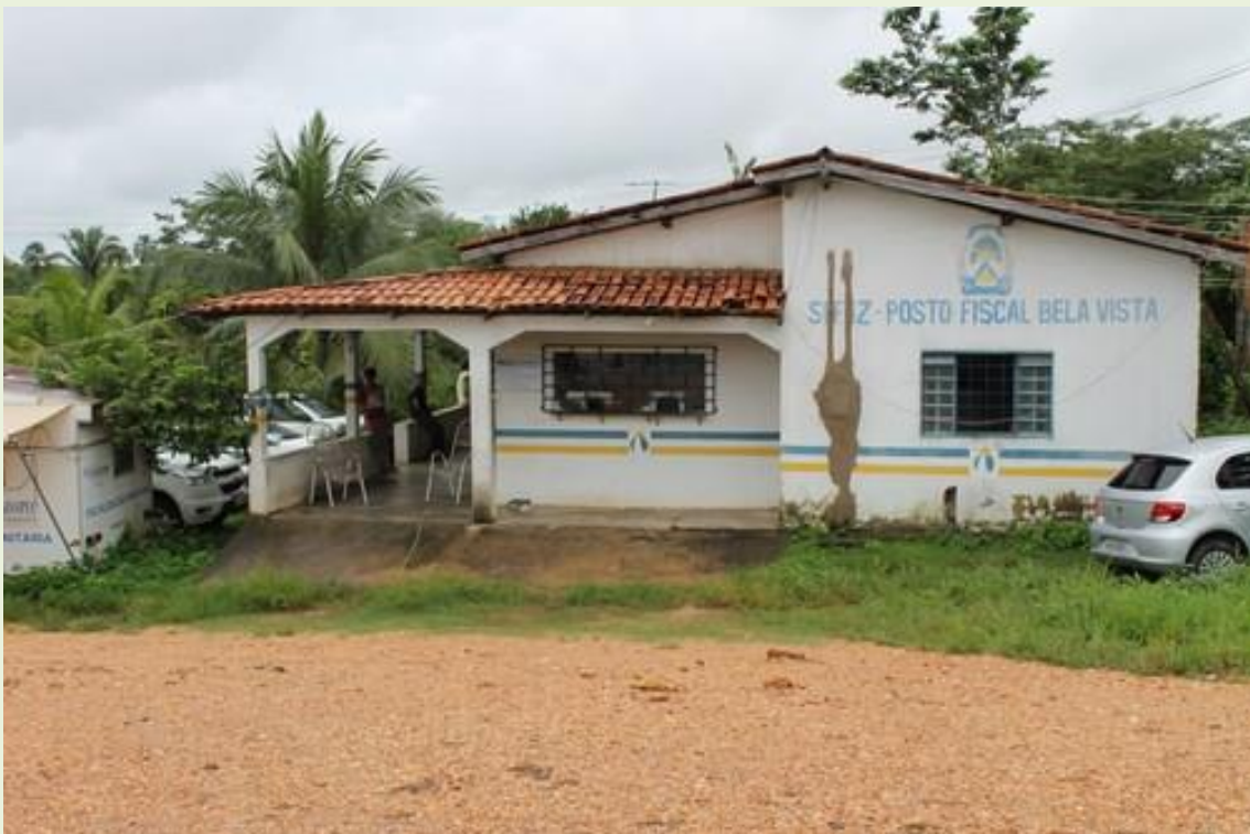
15.Entrada da unidade em época de chuvas acumula muita água, dificultando o acesso e aumentando o risco de acidentes;