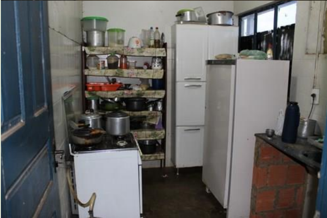
12. Mobiliário muito velho necessita de móveis novos;