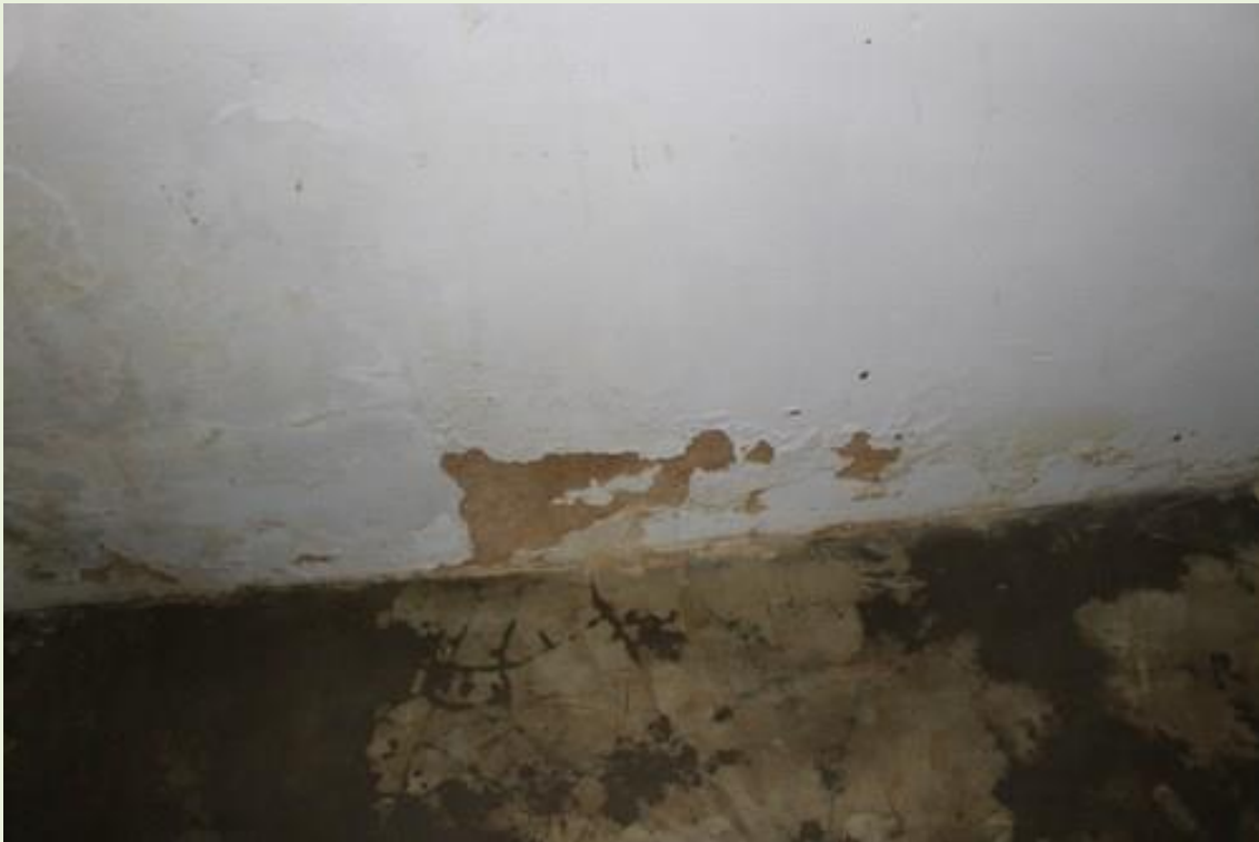
7. Paredes, pisos e rodapés com defeitos necessitando de reformas;