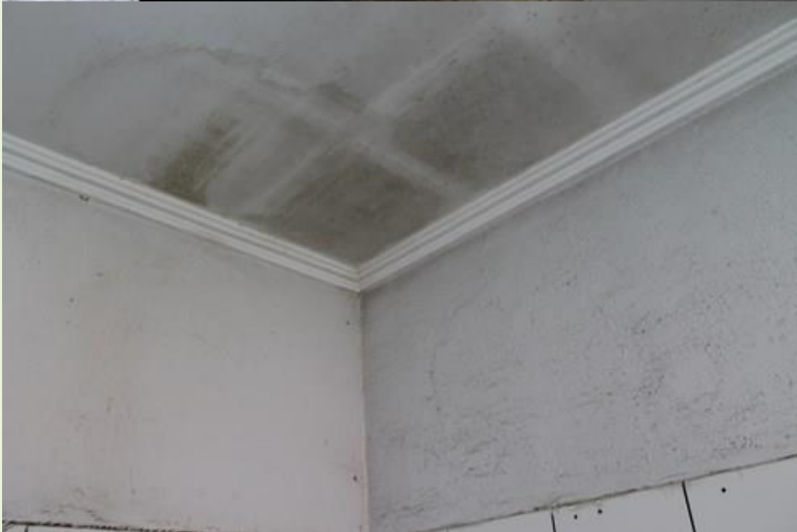
3. Paredes e tetos com infiltrações;