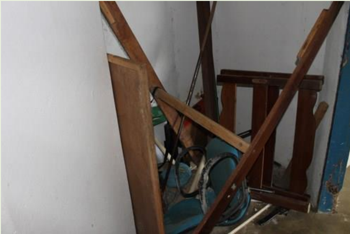
4. Móveis velhos e inservíveis guardados dentro do posto fiscal;