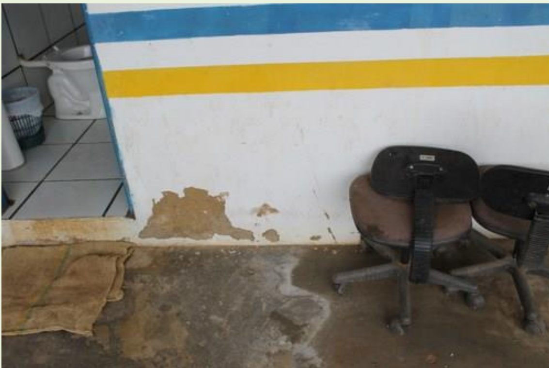
13.Cadeiras muito velhas;